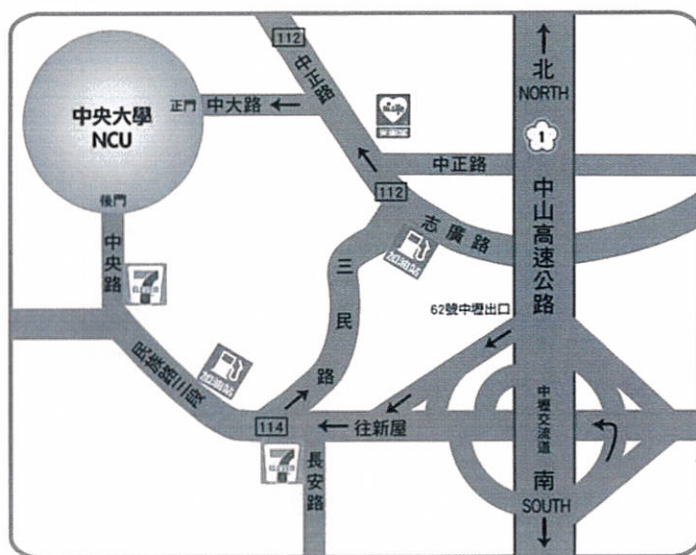
中央大學 交通路線圖

台鐵中壢站下車，前站出站後轉乘市區公車或計程車（車程 20~30 分鐘）抵達本校。請參閱市區公車搭乘說明。